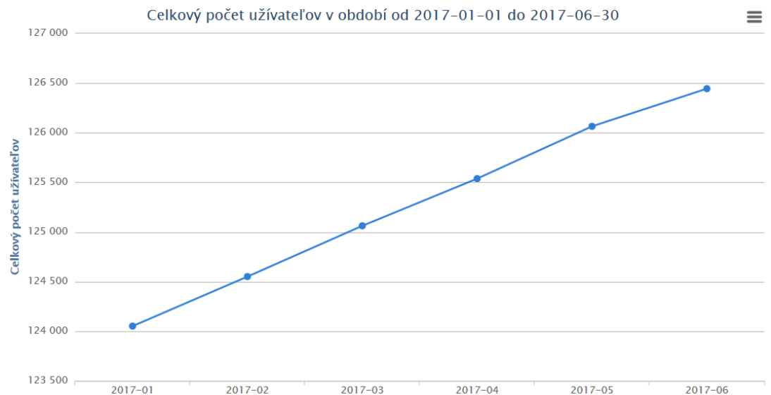
Tab. 2: Tabuľkový prehľad celkového počtu užívateľov v prvom polroku 2017